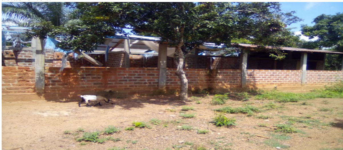
Image de la toiture de la bergerie, construit en partie par des bâches, en état de délabrement

Le bananeraie est l'activité dominante sur le site 2. Environ 500 pieds y sont plantés. Sur ce site, on a observé également les arbres fruitiers (orangers et pamplemoussiers) et les arbres à chenilles.