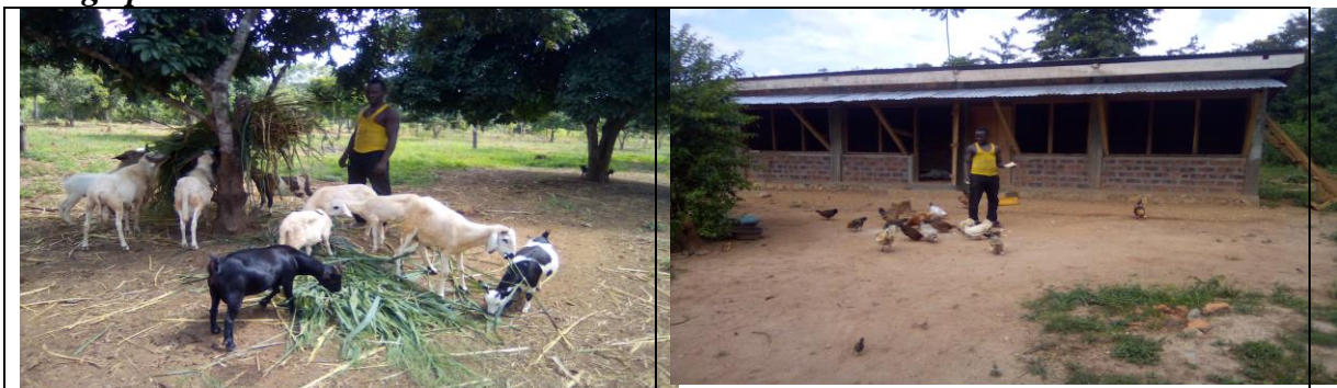
Image prise des activités menées sur le site 1

Un autre fait marquant, la mission a découvert sur ce site des pierres à lécher, pierres fabriquées localement à base du sel, de la coquille d'huitre, de l'urée et d'un peu de ciment, aidant pour la croissance des animaux et lutter contre les décès et les avortements chez eux.